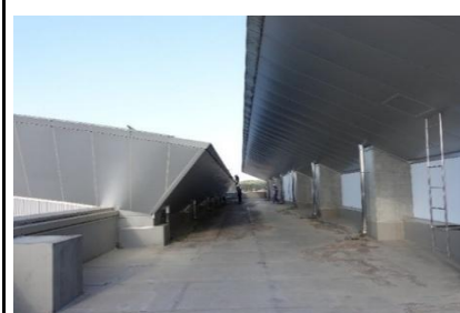
左:Bエリア、右:Cエリア