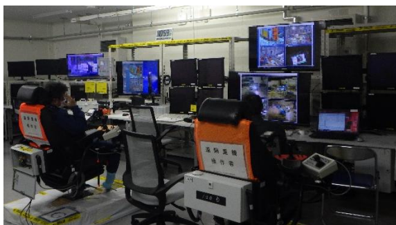
(写真1) 遠隔操作室での重機の操作状況