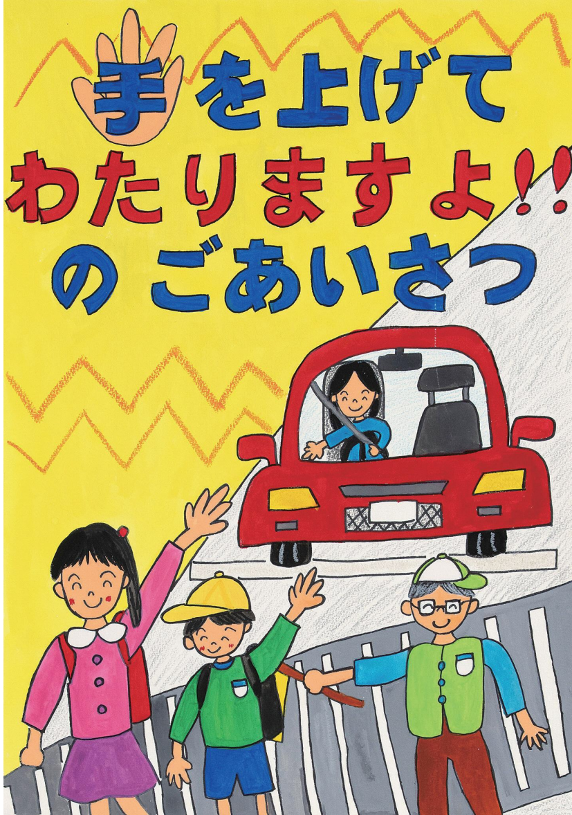
令和7年度JA共済福島県小・中学生交通安全ポスターコンクール 金賞 小学校4年生の作品

(福島県交通対策協議会 令和7年実施 福島県交通安全運動「年間スローガン」優秀賞作品)