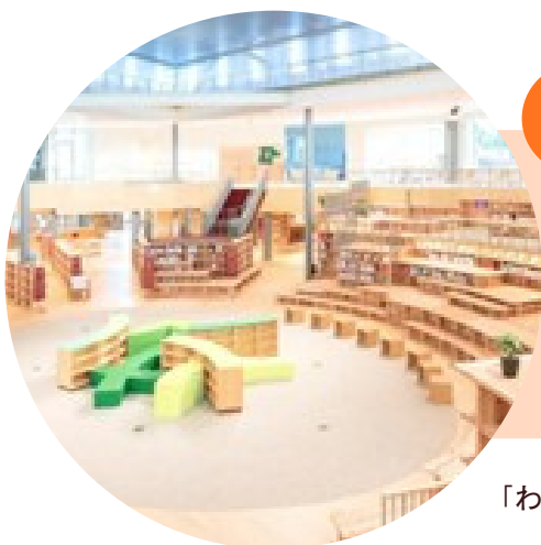
学び舎ゆめの森 「わくわく本の広場」