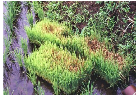
図2 置き苗から発生したいもち病

会津での葉いもちの初発は6月下旬です。移植時の箱処理剤や散布剤等で適切に防除しましょう。また、感染源となる補植用置き苗は早急に処分しましょう（図2、埋却する等）。