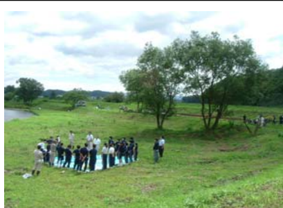
河川美化や水質調査に取り組む子供たち