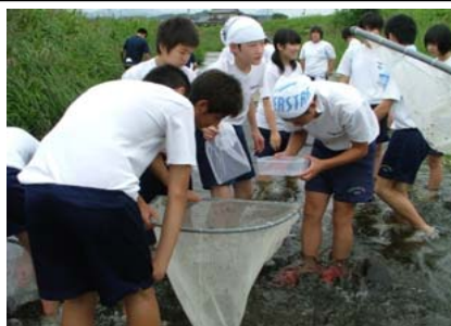
北海道や沖縄など子供たちと地元の子供たちの交流