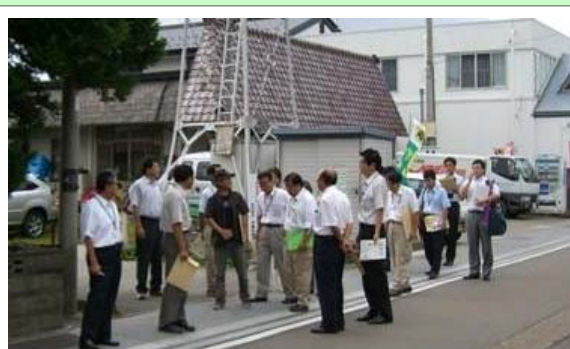
会津美里町本郷地区のまち歩き