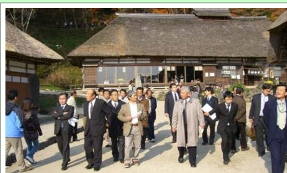
下郷町大内地区のまち歩き