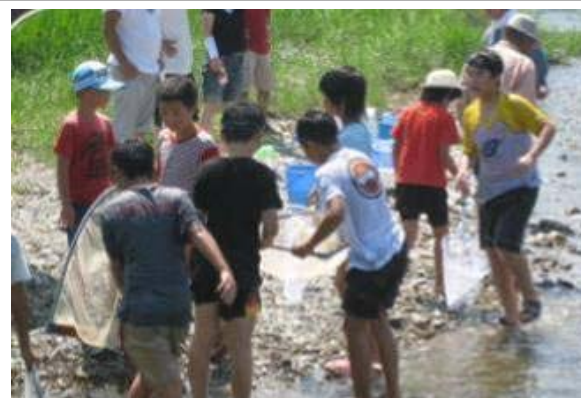
真野川で遊ぶ子どもたち

「きれいでなければ川には人は来ない。川に人がくればきれいになる。」との考え方から平成19年8月19日に「まのふえす2007～真野川遊び・・・初級編」を開催した。151名（内スタッフ54名）の参加がありました。