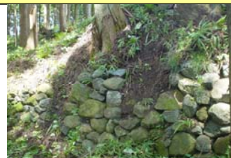
上遠野城跡(八塩見城)