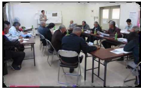
連絡調整会議の様子