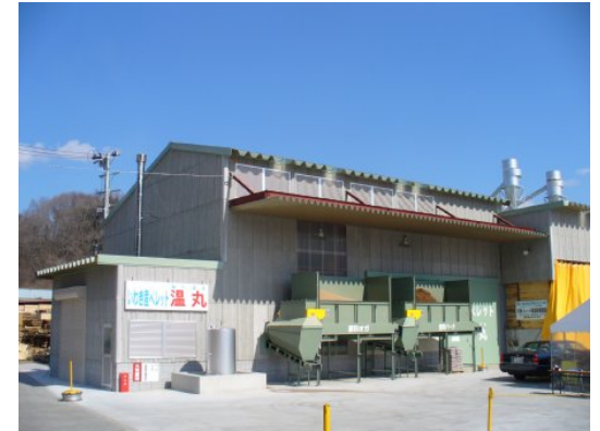
竣工した木質ペレット製造プラント