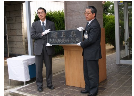
表札を外す松川農業試験場長と小山所長

4月からは、農業試験場いわき支場が行ってきた野菜・花きの試験研究業務は、新たに開設される福島県農業総合センターに引き継がれ、更なる発展が期待されます。