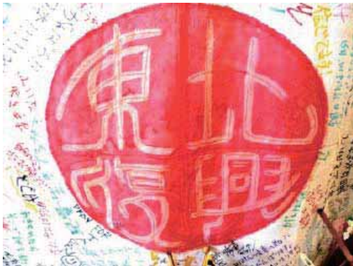
(みんなで誓い合った復興への旗印)

いわき市内への避難者数 1,088人 避難所への派遣県職員数 (県全体) 延べ10,000人以上 (いわき農林) 延べ95人