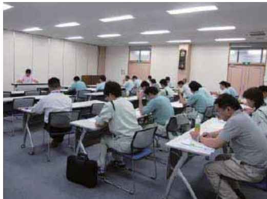
（水稻栽培講習会での講義の様子）

に、カメムシ類防除時の耕種的対策（農薬を使用しないで、耕作や品種による対策）、薬剤対策が、重要なポイントになります。