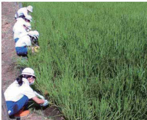
（米の収量予測のための分けつ調査の様子）

次に、分けつ調査では、稲の分けつ（稲の親株から子株が出て増えること。）の数を調べることによって、今年の収穫量を予測するというもので、調査の結果、昨年より多くの収穫が見込めるということが分かりました。