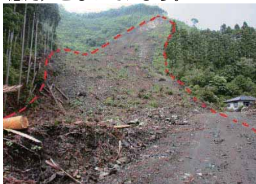
(事業計画が決定した緊急治山事業 田人町 綱木地区 余震による山腹崩壊 赤点線が崩壊範囲)

これらの災害復旧にあたっては、一部について資金の融資制度により対応していただくこととなりますが、公共施設については、国の査定(事業計画の決定、承認など)を受けた上で、国庫補助金などにより、復旧工事を実施することとなります。