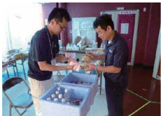
(食事配給の準備作業の様子)

各避難所において、食糧、灯油、衣料品等の調達が困難であったことから、県では不足物資等の調査を行うと共に、避難所へ職員を派遣してきましたが、仮設住宅や借り上げ住宅への移転に伴い、徐々に避難所内の人数も減ったため、7月20日で県職員の派遣を終了しました。