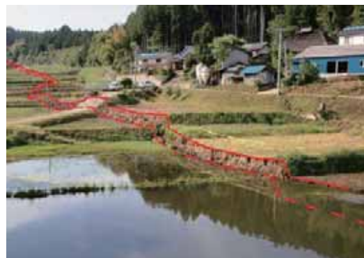
(災害復旧工事が待たれる 田人町塩ノ平地区 断層地震による農地の地割れ 赤点線が断層)

災害発生から4ヶ月を経過し、ある程度落ち着きつつあることから、その現状をお知らせします。