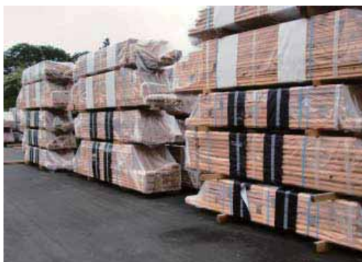
(出荷準備の整った仮設住宅用加工材)

同加工センターは、平成8年8月に、いわき市内の木材・製材業者5者といわき市森林組合が連携した組織として設置され、勿来工場と小川工場があり、そのプレカット材を生産する小川工場では、大震災による施設や敷地の被害はあったものの、幸い致命的では無かったことから、自らの復旧工事により事業を再開し、ログハウス協会東北支部が建設する仮設住宅の建築材料加工を協力会社として引き受けることにより、震災復興に大きく寄与することとなりました。