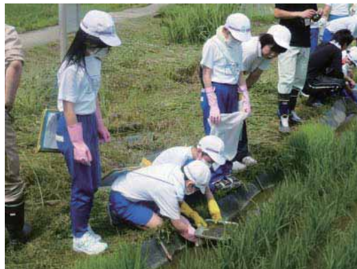
（トロトロ層をすくってイトミミズを調査する様子）

児童たちにとって初めての経験で、今まで見たことのないイトミミズの姿に歓声をあげながら、稲にとって有益な働きをするトロトロ層とイトミミズの関わりについて学習しました。