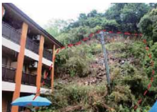
(事業計画が決定した緊急治山事業 常磐湯本町日渡地区 地震による山腹崩壊 赤点線が崩壊範囲)

この査定は、林業等が6月から、農地等が7月から実施されています。その結果、林業等については、11地区 645,738千円(治山施設 2地区、246,579千円、緊急治山施設 2地区 309,500千円、林道 7地区 89,659千円)農地等については、11地区 43,433千円(農地 3地区、6,353千円、農業用施設 8地区、37,080千円)について工事の実施が決定されました。(7/22 現在査定済み分までのデータによる。)