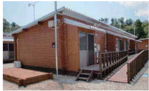
(協)いわき材加工センターが生産した加工材を使って完成した仮設住宅(二本松市杉田)