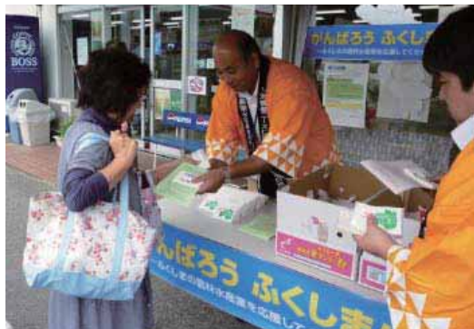
(JAいわき市新鮮やさい館でのキャンペーンの様子)

7月22日(金)、23日(土)の2日間、「がんばろう 福島!」運動の一環として、「旬の夏野菜を食べて、暑い夏を乗り切ろう!!」県内キャンペーンをJAグループ福島・福島県主催により実施しました。