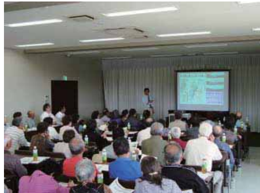
(第3支部総会後の野菜栽培講習会の様子)

加者からは、今後の営農方針や放射能汚染を軽減させる栽培方法について多くの質問が寄せられ、活発な質疑応答が行われました。