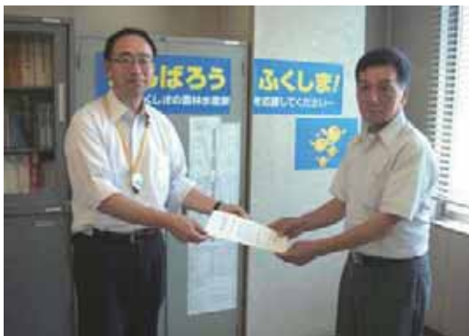
(農林事務所企画部長から委員会副会長に県モデル認定証を交付する様子)

これは、委員会が平成22年度に引き続き県モデルの認定を要望し、福島県ふるさと子ども夢学校推進協議会長から認定されたものです。