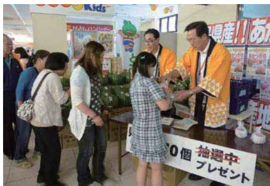
(マルトショッピングセンター高坂店でのキャンペーンの様子)

JAいわき市新鮮やさい館谷川瀬店では開店時間の9時30分から、マルトショッピングセンター高坂店では16時から、先着70名に福島県(桑折町)産のモモをプレゼントしたほか、モニタリング結果やレシピ付のチラシを配布し、夏の農産物をPRしました。