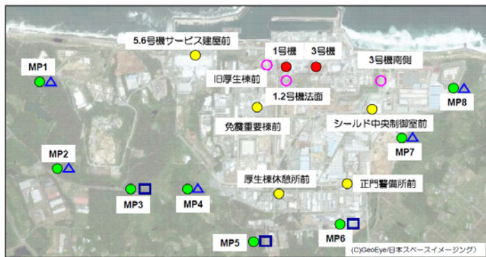
(参考) モニタリングポストとダストモニタの設置地点

※モニタリングポストのリアルタイムデータにつきましては、当社ホームページ「福島第一原子力発電所構内でのモニタリングポスト計測状況」 http://www.tepco.co.jp/nu/fukushima-np/f1/index-j.html からご覧いただけます。