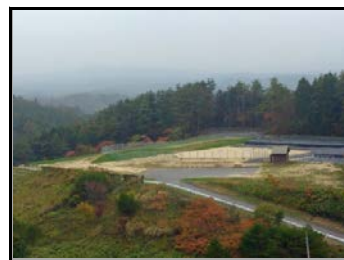
夏井地区仮置場(全景)