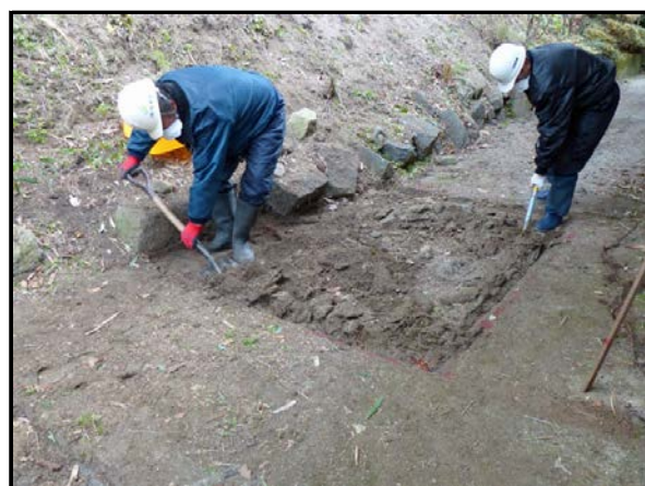
夏井地区除染作業