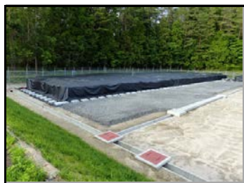
夏井地区仮置場(可燃物)