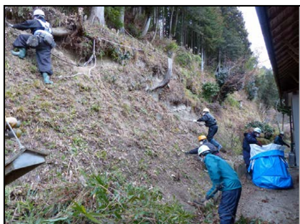
夏井地区除染作業