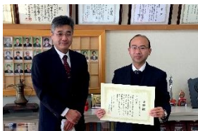
学校賞【最高応募率】（鮫川小）