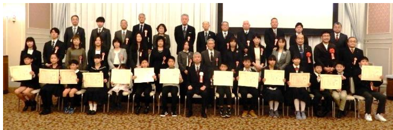
【県表彰式集合写真】