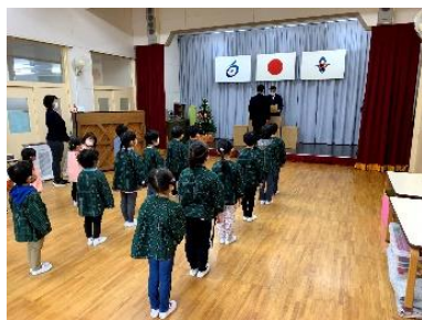
優良PTA文科大臣表彰伝達式12/7(小田川幼稚園)