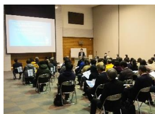
学校運営協議会の説明会12/3(熊倉小)