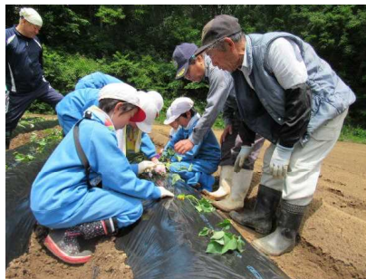
さつまいも苗植え(5/25) 【山岡小学校】