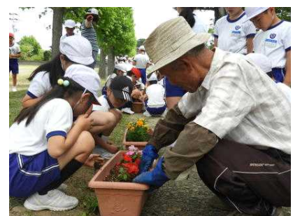
花の苗植え(6/8) 【社川小学校】