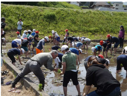
稲作体験：田植え(5/11) 【塙小学校】

前年度までの「つなごう“ふる郷”体験事業」が、今年度より3ヵ年計画の予定で事業名が変わりました。