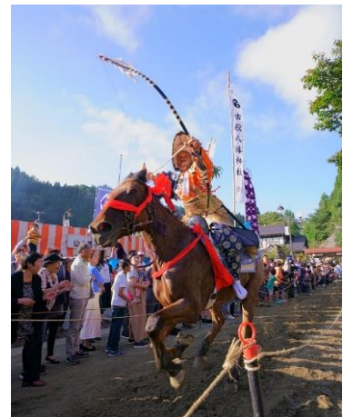
古殿八幡神社例大祭 流鏝馬の様子

また、住民さんや町の雰囲気がとても温かいので、初めて古殿町に来た方でも、どこか懐かしく感じられる、そんな魅力溢れる町です！