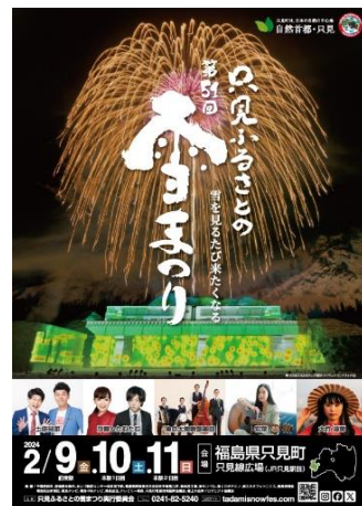
只見ふるさとの雪まつり