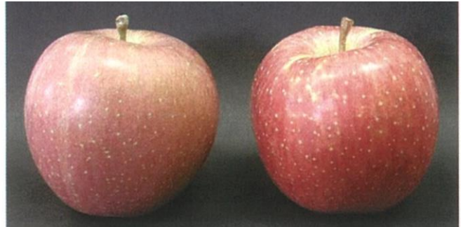
図2 「青実果」（左）と「正常果」（右）の外観 （H22 富山県農林水産総合技術センター園芸 研究所研究報告 より引用）

右の写真のように、果皮は果点の盛り上がりがなく滑らかで、地色が抜けきらず、色の鮮やかさがありません。また、糖度が低く、果肉が硬く、酸味が少ない食味の劣る果実で、商品性は極めて低いです。