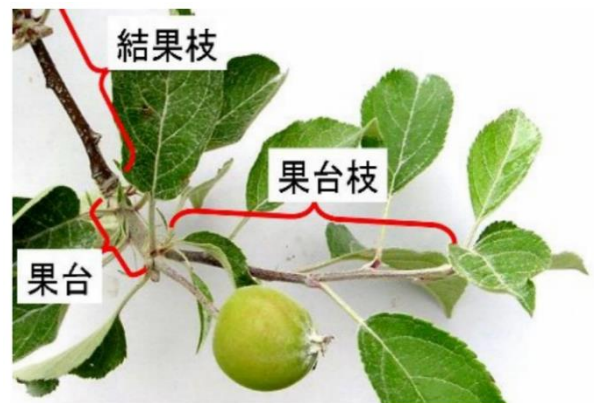
図3 着果部位の名称

前年の気温の上昇によって樹勢が旺盛となった結果、長い結果枝の比率が高まるとともに、当年の高温により長い果台や果台枝の割合が増加して、青実果の発生が増加すると考えられます。