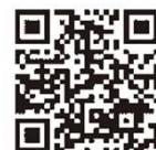
認証キーの取得方法 発注者への提出方法