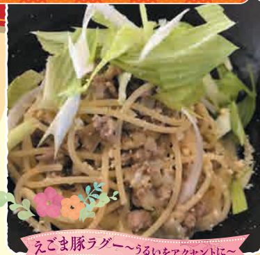
えごま豚ラグー〜うらいをアクセントに〜