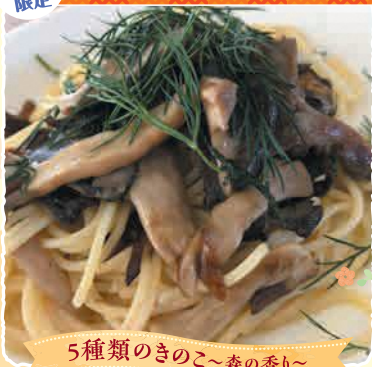
5種類のきのこのこ〜森の香り〜