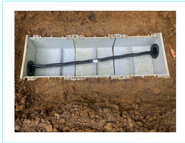
高圧ケーブル通線 施工写真 工事進捗17.2% (通線全長5420mの内936m施工完了)