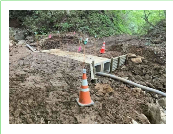
排水構造物工 施工写真 工事進捗80.0%