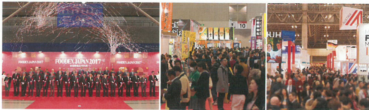
左：各国大使等によるオープニングセレモニー 中央・右：昨年は82,434名が来場（画像はすべて「FOODEX JAPAN 2017」）