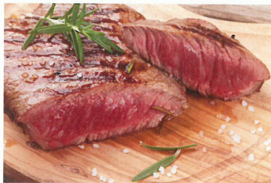
国内外から肉・肉加工品が一堂に！（イメージ）

肉の消費量が増加傾向にあり、海外からも注目されている日本市場。近年は霜降りの黒毛和牛だけでなく赤身肉や熟成肉が好まれるなど嗜好が多様化しています。本展示会では、製造段階で加熱しないためソーセージ本来の旨みとジューシーさが際立つ「生ソーセージ」、完全放牧され牧草だけを食べて育ち、低脂肪低カロリー、オメガ3脂肪酸を豊富に含むなど、美食家にもヘルシー志向の方にも人気の「グラスフェッドビーフ」、ベジタリアンなど健康的なライフスタイルを実践する方に好まれる「ソイミート」など、国内外の様々な肉・肉加工品をご覧ください。