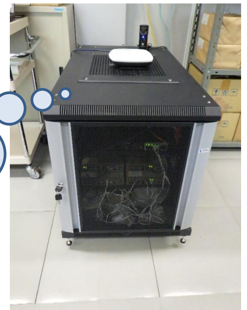
<アクセスポイント等>