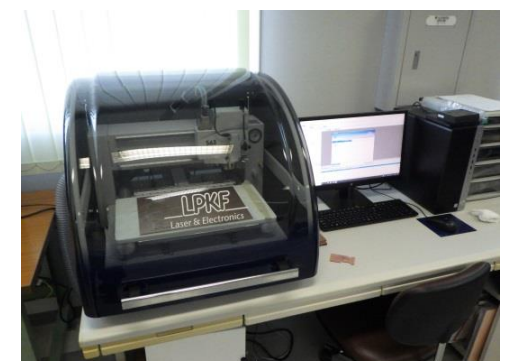
AI・IoT開発支援システム （4,830円/時間）

○その他の施設・設備は、福島県ハイテクプラザ 施設・設備データベースからご覧いただけます。