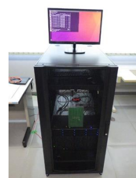
共有AIプラットフォーム （7,160円/時間）